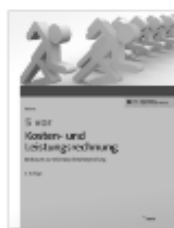
NWB: 5 vor Kosten- und Leistungsrechnung