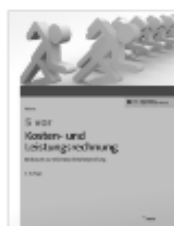
NWB: 5 vor Kosten- und Leistungsrechnung