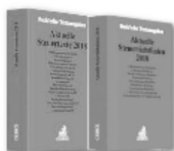
Beck: Aktuelle Steuertexte und Steuer Richtlinien