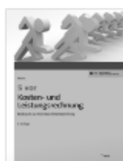
NWB: 5 vor Kosten- und Leistungsrechnung