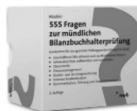
NWB: 555 Fragen zur mündlichen Bilanzbuchhalterprüfung