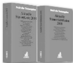
Beck: Aktuelle Steuertexte und Steuer Richtlinien