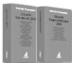
Beck: Aktuelle Steuertexte und Steuer Richtlinien