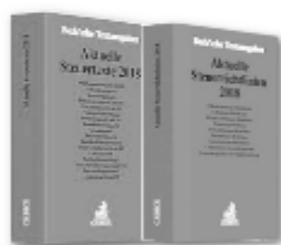
Beck: Aktuelle Steuertexte und Steuerrichtlinien