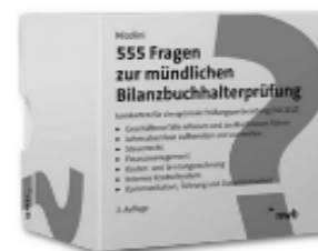
NWB: 555 Fragen zur mündlichen Bilanzbuchhalterprüfung

➔ Jetzt informieren und kostenfrei beitreten: bvbc.de/karrierekick