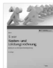
NWB: 5 vor Kosten- und Leistungsrechnung