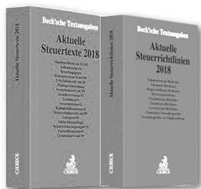
Beck: Aktuelle Steuertexte und Steuerrichtlinien