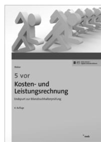
NWB: 5 vor Kosten- und Leistungsrechnung