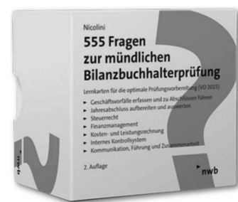
NWB: 555 Fragen zur mündlichen Bilanzbuchhalterprüfung

➔ Jetzt informieren und kostenfrei beitreten: bvbc.de/karrierekick