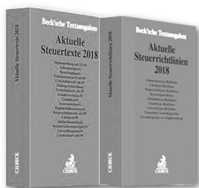
Beck: Aktuelle Steuertexte und Steuerrichtlinien