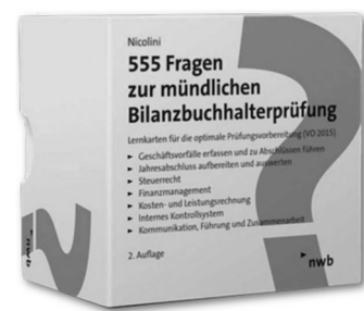
NWB: 555 Fragen zur mündlichen Bilanzbuchhalterprüfung

➔ Jetzt informieren und kostenfrei beitreten: bvbc.de/karrierekick