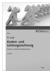
NWB: 5 vor Kosten- und Leistungsrechnung